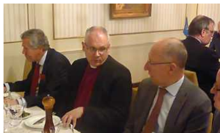
Klubbafton den 30 oktober 2019 med biskopen i Borgå Bo-Göran Åstrand, här mellan Mikael Westerback och Erik Werner