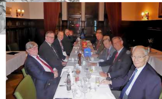
Tyst klubbafton den 19 februari.