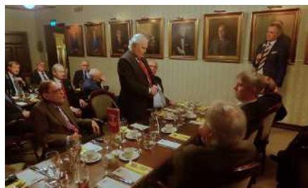
Klubbafton den 22 januari med riksdagsledamot Anders Adlercreutz.