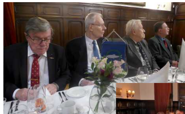
Tyst klubbafton den 5 februari.