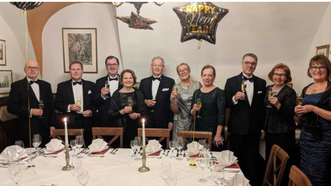
Totalt tio personer deltog i nyårsfirande i Wien. En detaljerad beskrivning av resan i verksamhetsberättelsen.