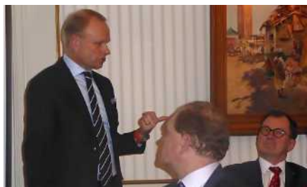
Klubbafton den 29 januari med Pekka Lundmark från Fortum.