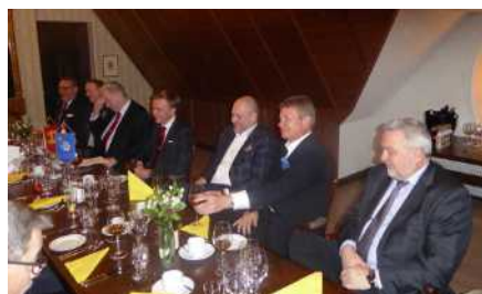
Träff med styrelserna för Klubben och MM den 5 februari.