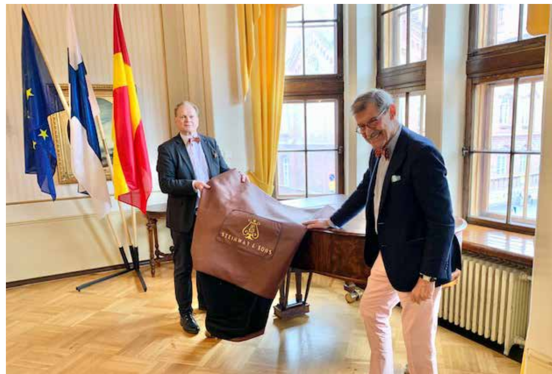
Klubben har låtit reparera Steinway flygelns täckelse och målat om Barocken i andra våningen i en vacker grön färg.

Svenska Klubben i Helsingfors r.f. verksamhetsberättelse och bokslut 31.12.2020 inklusive granskningsberättelserna delades ut till de närvarande på Klubbens årsmöte i april 2021. Materialet finns i sin helhet på Klubbens hemsida www.klubben.fi under de slutna medlemssidorna. En länk till materialet finns även på Klubbens sluta Facebook sida.